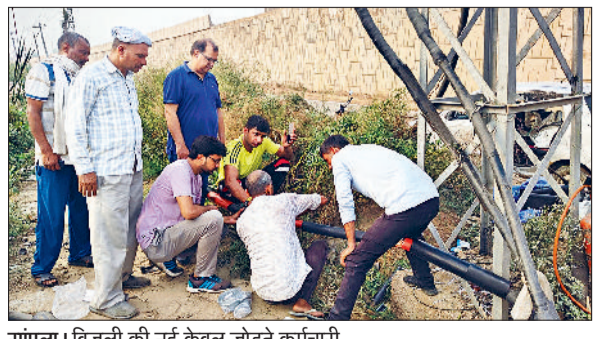
सांपला। बिजली की नई केबल जोड़ते कर्मचारी